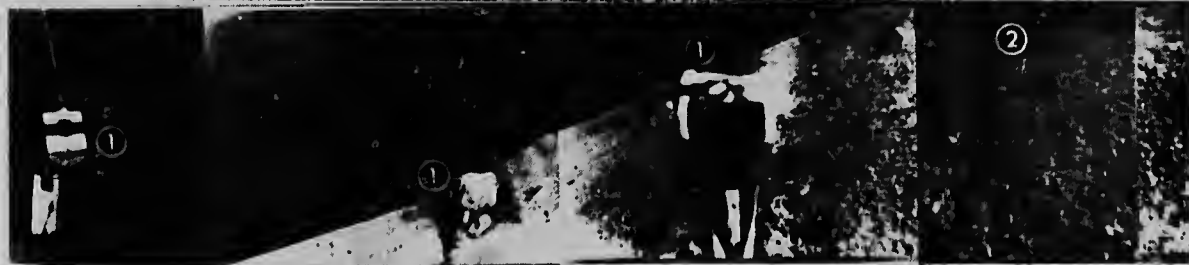
E dos fotonan aki ta muestra un vista panoramico di luna. Autoridadnan ruso a duna e foto na publicidad. Por mira algun obheto te na un distancia di un milla leeuw riba e foto. E craternan qu ta ser mira, posiblemente ta mes grandí qu man di un hende. E imagen riba foto 5 ta causá pa e glas qu ta refleja un otro parti di luna -- Radiophoto UPI.

E hoben venezolano aki tabata e prome venezolano cu a muri den guerra na Vietnam. El a bai Estados Unidos na anja 1963 i mas o menos un anja despues el a drenta ehército di infanteria di marina aya. Na agosto di 1965 Figueroa a ser manda Vietnam, como integrante di tercer division di infanteria di marina.